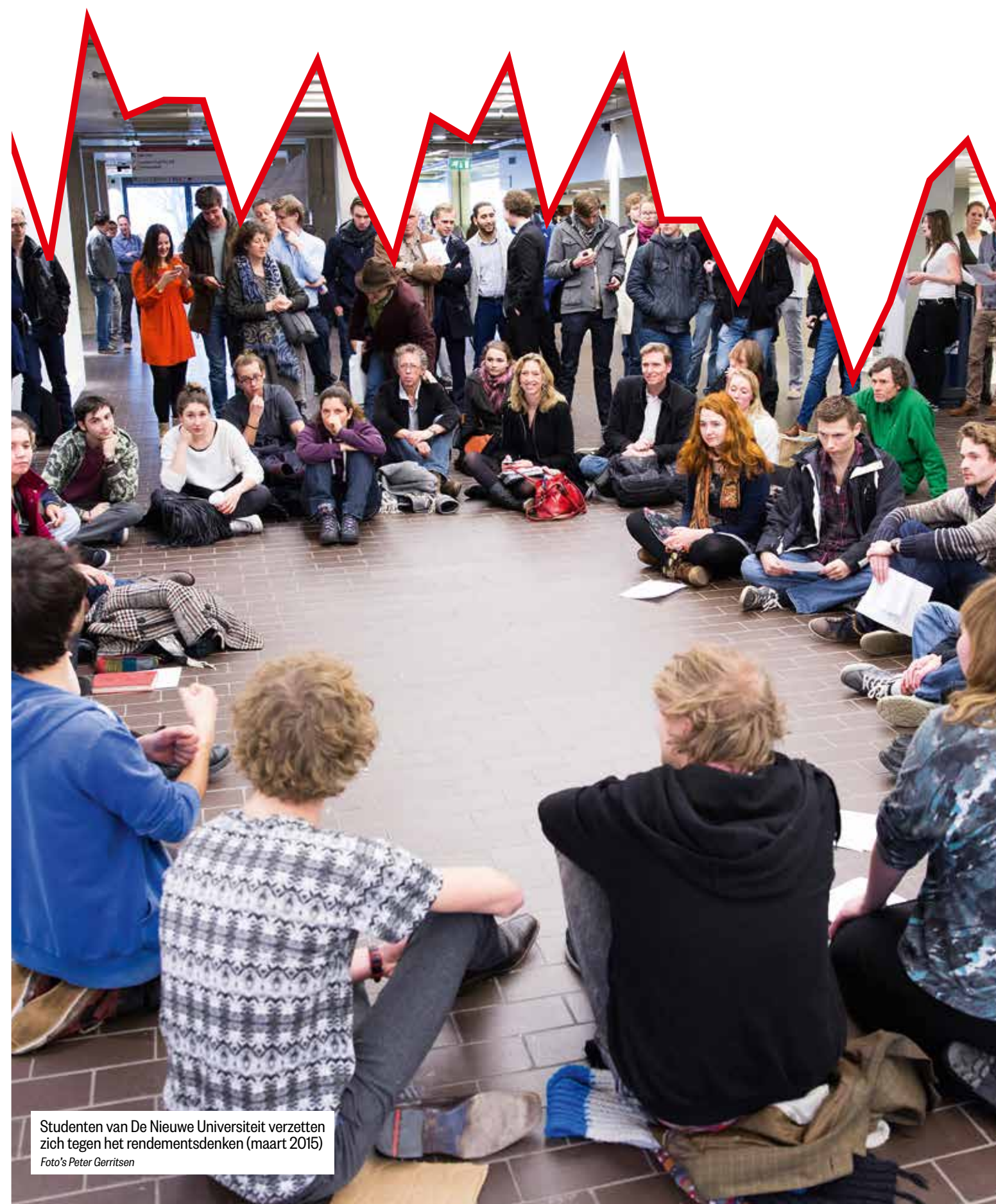
Studenten van De Nieuwe Universiteit verzetten zich tegen het rendementsdenken (maart 2015)

Hij verwacht niet dat het universitaire onderwijs over de hele linie erop achteruit is gegaan. Vooral doordat er de laatste jaren juist veel in het onderwijs geïnvesteerd wordt met extra contacturen voor studenten en meer intensiverende werkvormen in de colleges: “Ik denk zelfs